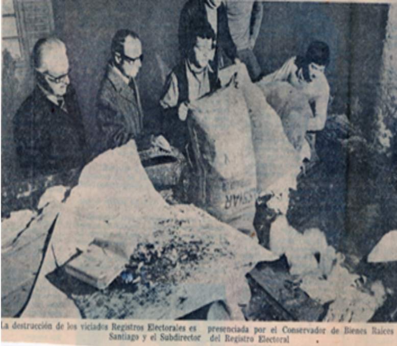
La destrucción de los viejos Registros Electorales es presenciada por el Conservador de Bienes Raíces Santiago y el Subdirector del Registro Electoral.

A continuación, analiza las siguientes fuentes históricas para realizar el taller que se presenta al final de esta guía