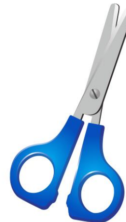
Tijeras punta roma