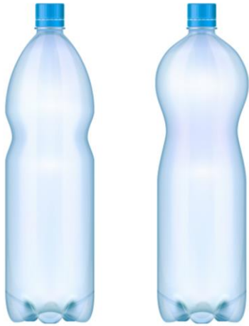
Botella de plástico (tamaño y forma que desee)