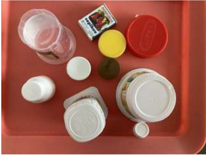
Tapas, envases y cajas de diferentes tamaños