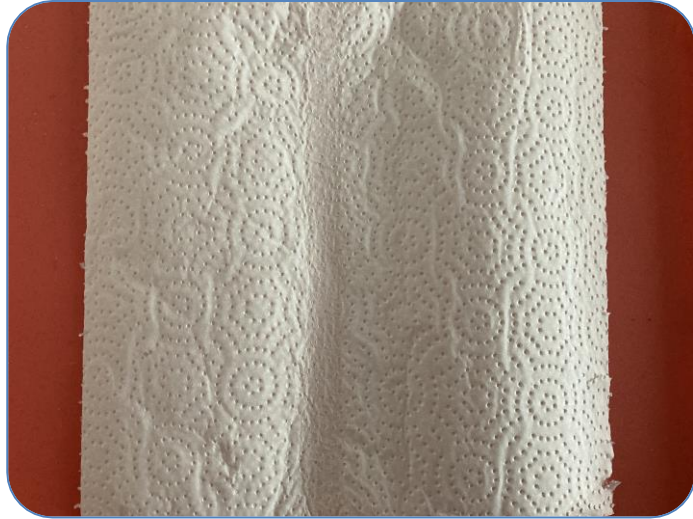
Trozo de toalla absorbente con textura