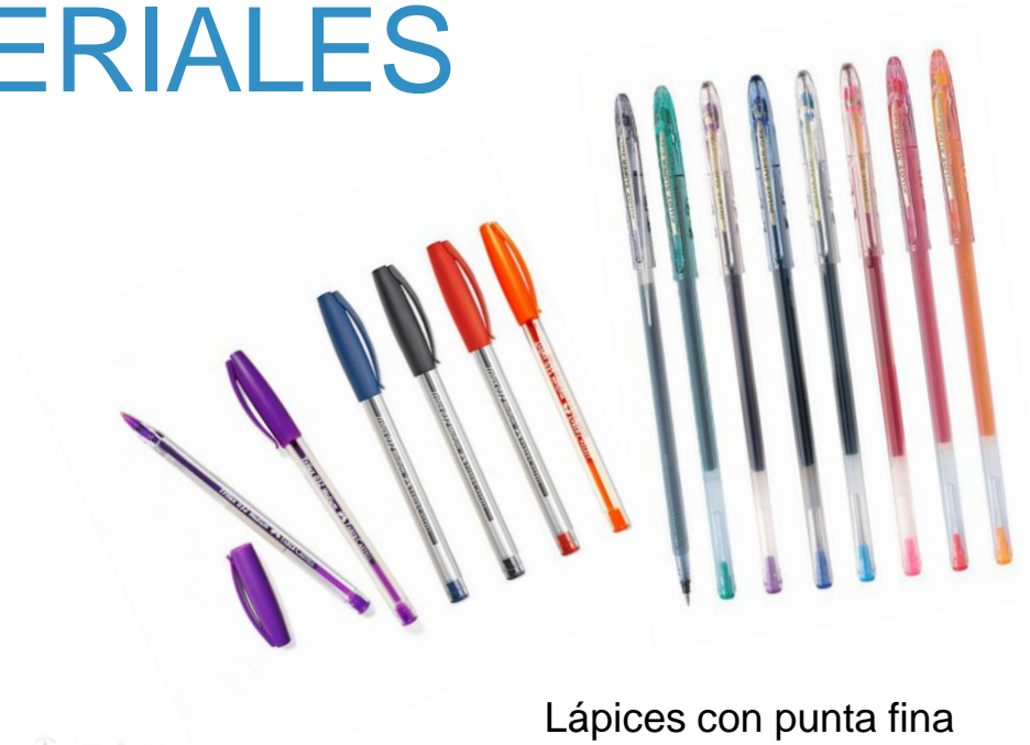
Lápices con punta fina