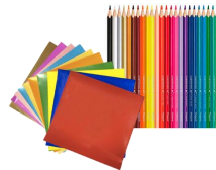
Elementos para decorar