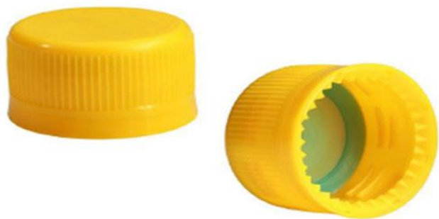
Tapa de bebida