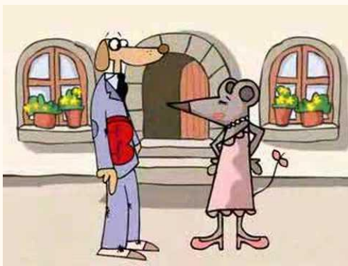
El Sr. Perro