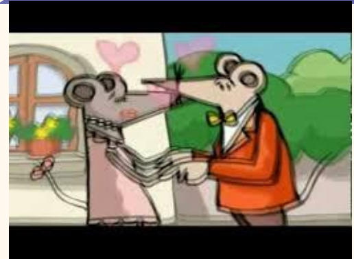
El Sr. Ratón