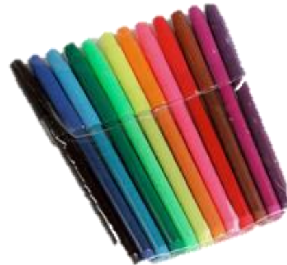
Lápices de colores (los que tengas en tu casa)