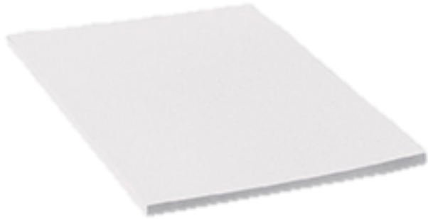
Hoja en blanco