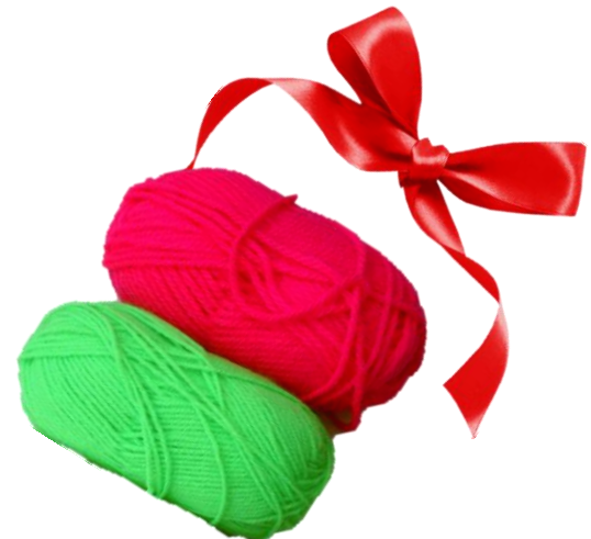
Lana o cinta (o lo que tengas para hacer un PINCHE)