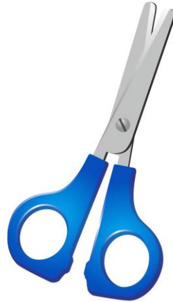
Tijeras punta roma