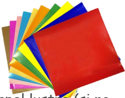
Papel lustre (si no tienes pinta una hoja en blanco con tus colores favoritos)