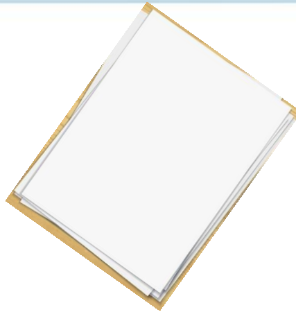
Hoja en blanco